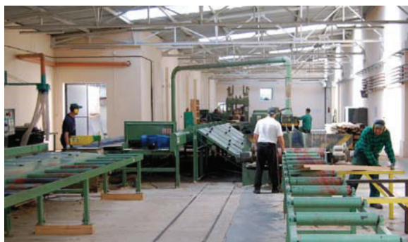
Liniję przetrarcia obsługuje tylko sześciu pracowników.

Spółka BIOFACTORY z Biecza, która 19 września zadebiutowała na giełdzie, jest w fazie restrukturyzacji i przechodzenia od produkcji prostych wyrobów drzewnych do bioenergetyki.